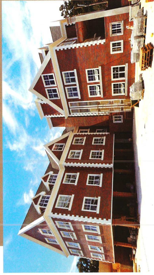
Projeto Calderari Construções Ltda.

The architectural project of the law office was developed by Calderari Construções Ltda.